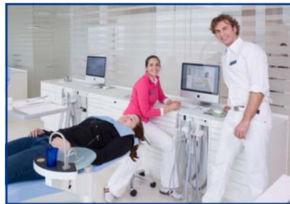
Praxissoftware ErgoDent: Effiziente und einfache Dokumentation – direkt im Behandlungszimmer.