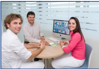
Eine umfassende individuelle Beratung führt zu einer optimalen Integration der EDV in das Praxiskonzept.

Dank der frühzeitigen Planung mit mehreren Besprechungen zwischen den Praxiseigentümern, der CCS AG und anderen beteiligten Unternehmen, wurden die Arbeitsinstrumente gut aufeinander abgestimmt, was wiederum eine reibungslose Installation gewährleistet hat. Damit das neue EDV-System vom Beginn weg optimal eingesetzt werden konnte, fanden die Schulungen an mehreren Terminen direkt in der Praxis statt. Zu Beginn wurden nur die Funktionen besprochen, die für den täglichen Betrieb unabdingbar sind. In den folgenden Schulungen wurden weitere Funktionen erläutert. Gleichzeitig konnten Fragen, die während den ersten Wochen aufgetaucht sind, direkt geklärt werden. Durch dieses Vorgehen konnten die Instruktoren besser auf die Bedürfnisse des Teams eingehen und die Anwendung des Systems durch das Team wurde schrittweise verbessert.